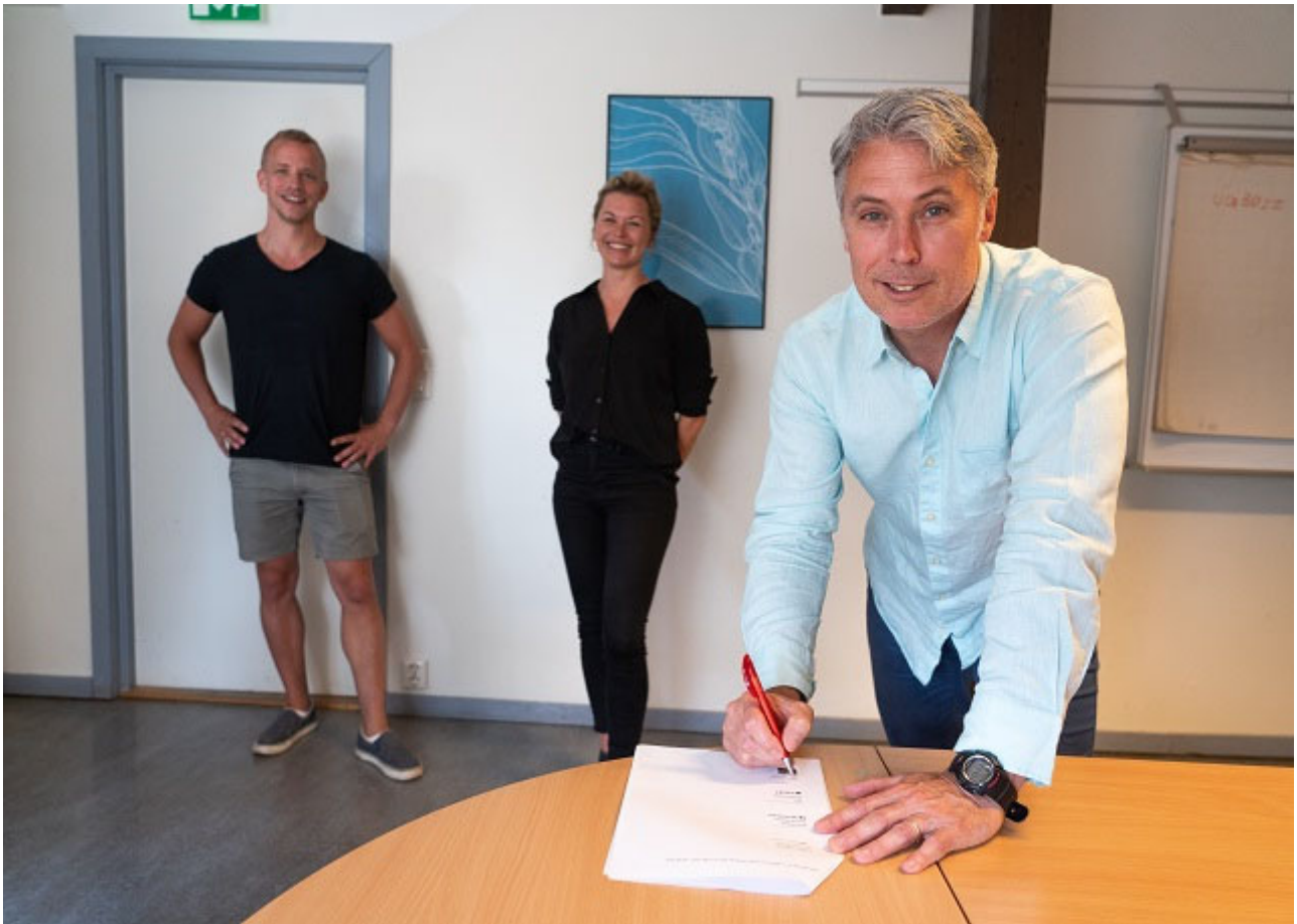
Bilde: Signering av kontrakt

påske to misjonsturer hvor kristenruss får bli kjent med Stefanusalliansens arbeid. De første turene går til en bibelskole i Udon Thani i Thailand og til Antalya evangeliske kirke i Tyrkia. Her skal kristenrussen drive ulikt hjelpearbeid og aktiviteter.